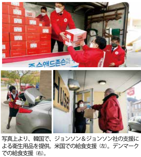
写真上より、韓国で、ジョンソン&ジョンソン社の支援による衛生用品を提供。米国での給食支援(左)。デンマークでの給食支援(右)。

三月の間に、新型コロナウイルス感染症は瞬く間に世界中に広がりました。各国で都市閉(封鎖)や、外出禁止指示などがなされ、それぞれの国の救世軍は、緊急給食支援や医療・衛生用品の提供に尽力しています。米国やカナダなどでは、政府から多大な資金が託され、貧困家庭や街頭生活者への支援や日ごとに増すニーズに応える働きをおこなっています。また、多くの国でインターネットを駆使して、礼拝やメッセージの動画を配信したり、同時参加できるアプリを使って交わりを保っています。