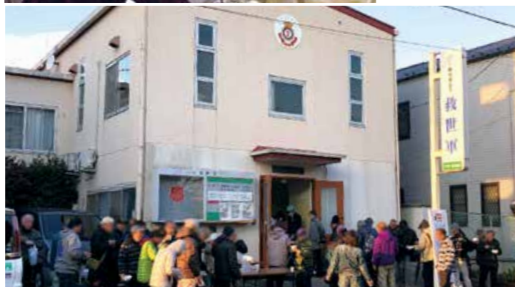
写真上より ・大森小隊 ・八幡小隊による「アベック八幡作業所」訪問 ・八幡小隊による母子支援施設「わかくさ」訪問 ・「わかくさ」利用者からのお礼状 ・横浜小隊による街頭生活者支援のボランティアの様子 ・横浜小隊からの支援品を受け取る人々