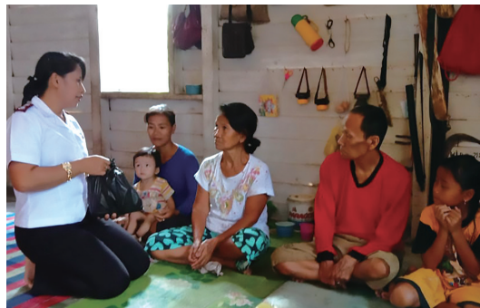
インドネシアでは、女性たちの経済的な状況やスキルを向上させる機会を提供しています