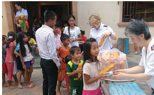
カンボジアでは、毎週日曜日に、いろいろな場所で85～360人の子どもたちに食事を提供しています