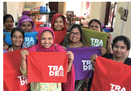
誇りをもって働くバングラデシュの女性たち

その後、米国に戻った私は、米国での「アザーズ」製品の市場を確立しました。救世軍の創立者ウイリアム・ブースが、著書『最暗黒の英国とその出路』で言及したように、人間にとって、堅実でやりがいのある仕事が必要であることを救世軍は認識しています。 それは、今の時代も同じです。労働者の権利が保護され、十分な収入を生み出し、適切な社会的保護が与えられる生産的な仕事は、「持続可能な開発目標」(SDGs)の一つ、八番目