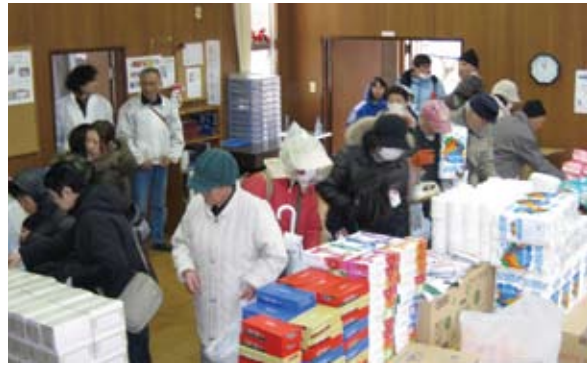
16日、東京東海連隊チームが、福島県白河方面へ行き、矢吹町に温かいお弁当と救援物資を届ける