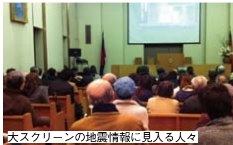
大スクリーンの地震情報に見入る人々