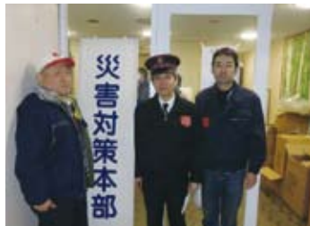
15日、男子社会奉仕センター(バザー場)が、水戸市の避難所へ救援物資を届ける

地震発生当日、救世軍本部(東京神田神保町)のホールは、帰宅できない人々のための休憩所、案内所として開放されました