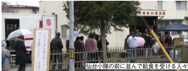
仙台小隊の前に並んで給食を受ける人々