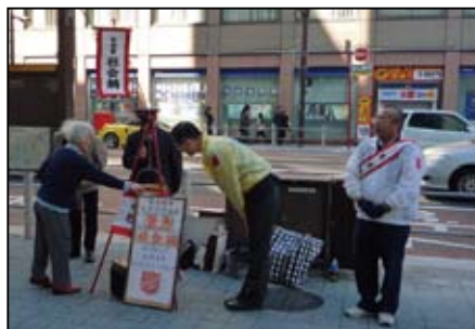
北九州市の八幡小隊の社会鍋