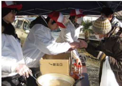
19日、社会福祉部・医療部チームが仙台小隊で温かい豚汁とお弁当の給食をおこなう。医療品を気仙沼へ向かう便に託すことができた。