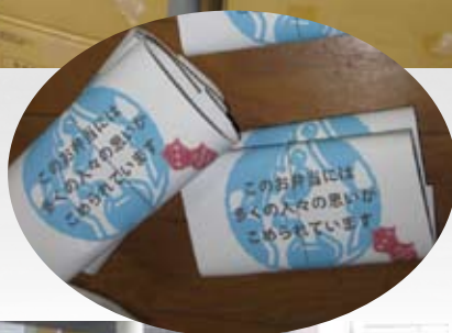
被災者の方々にお渡し した温かいお弁当 →