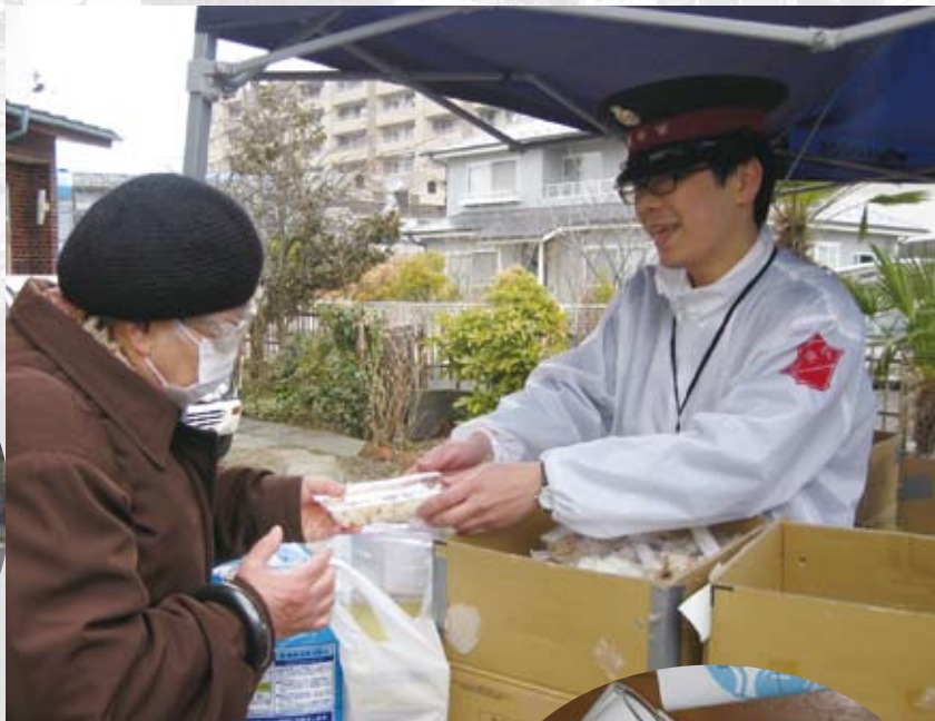
お弁当どうぞ！ おからだに気をつけて